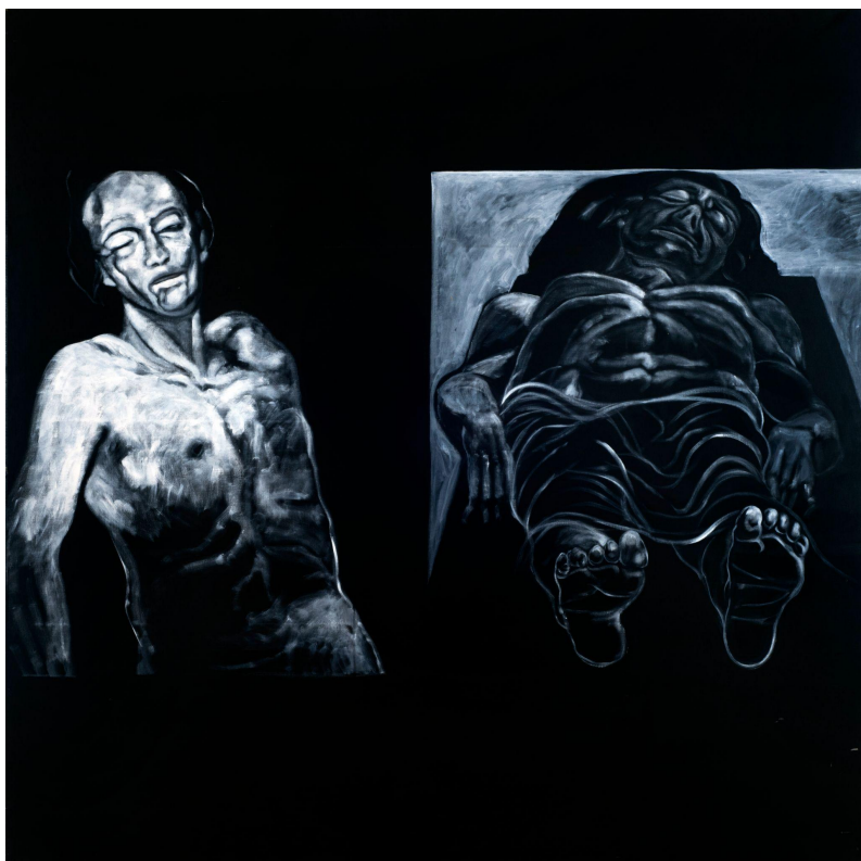
Ernesto Deira Sin título, de la serie "Identificaciones", 1971 Acrílico sobre tela, 200 x 200 cm

En el margen derecho de la tela, Deira vuelve su mirada sobre el Cristo muerto de Andrea Mantegna, mientras que en el extremo izquierdo ubica un cuerpo desnudo cuyos brazos y piernas se pierden progresivamente sobre el fondo de la superficie.